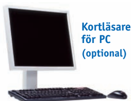
Kortläsare för PC (optional)

Läkaren använder medithera medical system