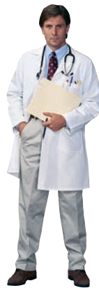
Kontroll vid bestämda tidpunkter